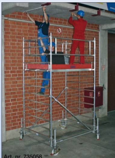
Art. nr. 735058