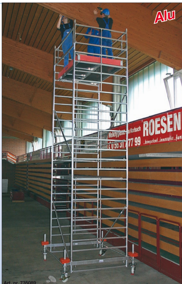
Art. nr. 735089

Important: În funcție de varianta de execuție se vor utiliza contragreutăți (accesorii).