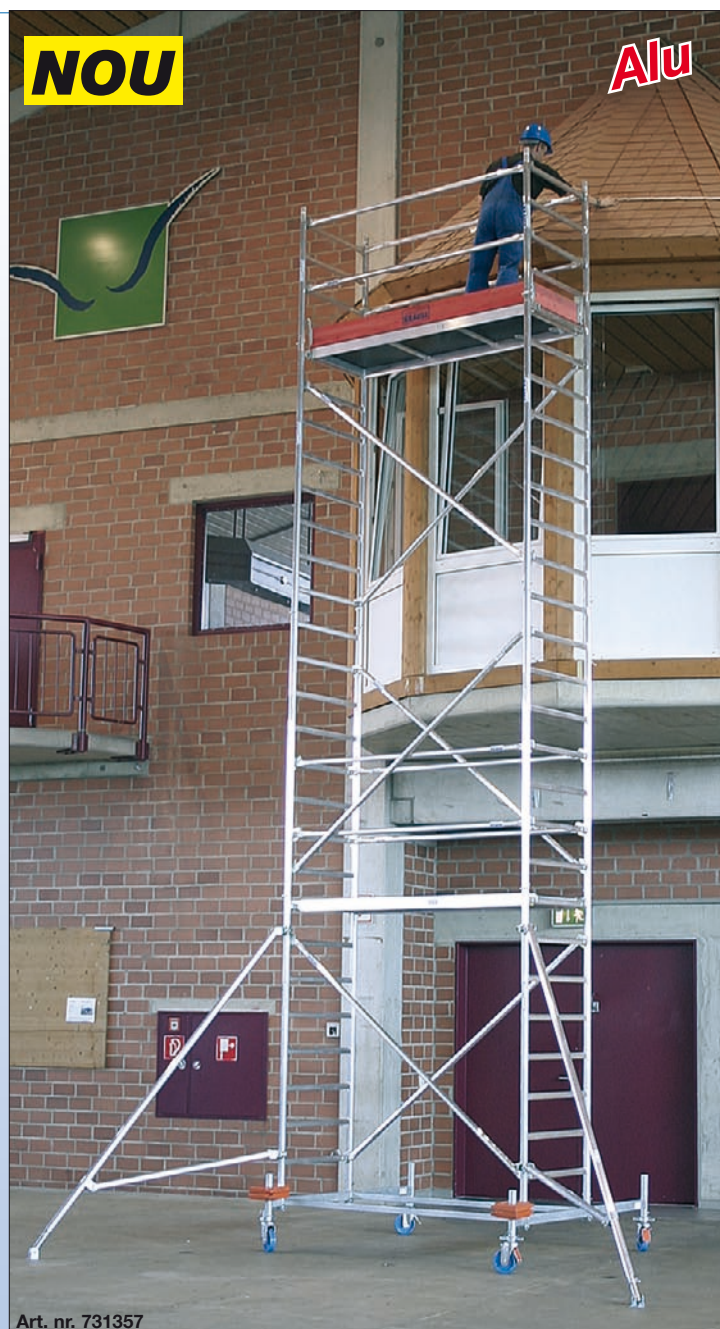
Art. nr. 731357

Important: În funcție de varianta de execuție se vor utiliza contragreutăți (accesorii).