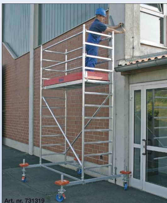
Art. nr. 731319