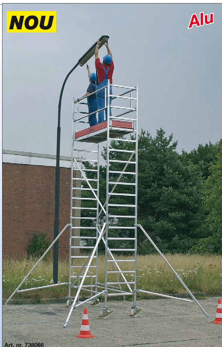
Art. nr. 738066

Important: În funcție de varianta de execuție se vor utiliza contragreutăți (accesorii).