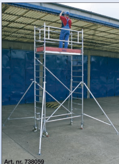
Art. nr. 738059